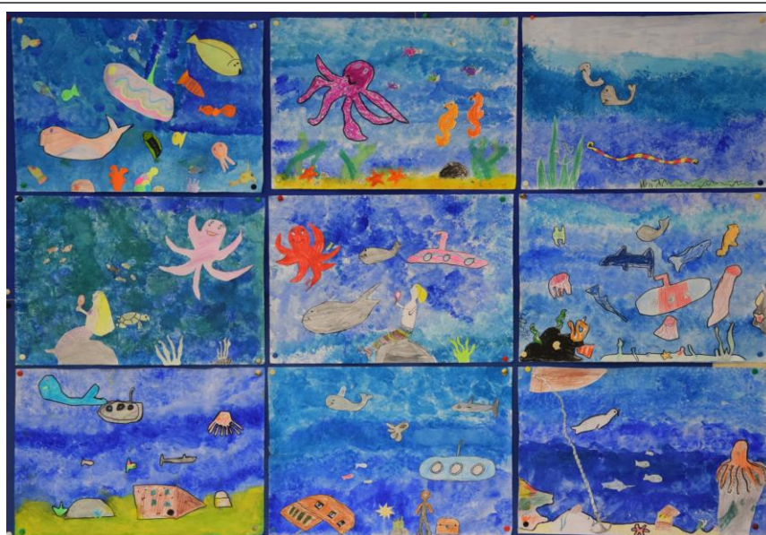
(Unterwasserwelten, Quelle: Klasse 3b, 05/2017)